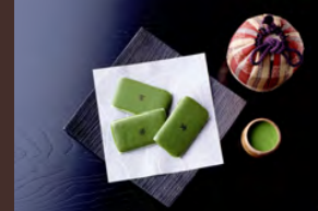
マールブランシュ