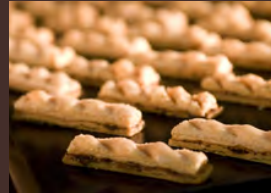
ルミゼドゥアッシュ