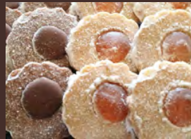
ミッシェルパッハ